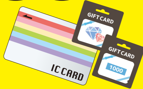
※電子マネーカードのイラストはイメージです。

コンビニ等で販売されている電子マネーカード… 被害者はこのように言われて、だまされて購入しています!