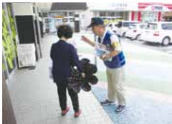
▲ATM利用者に声をかける様子