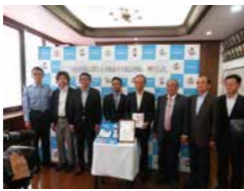
▲被害防止機器贈呈式の様子