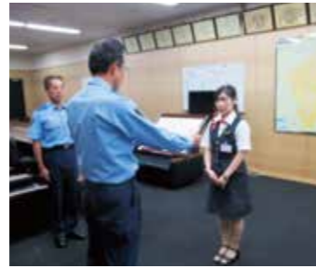
▲マイスター認定の様子