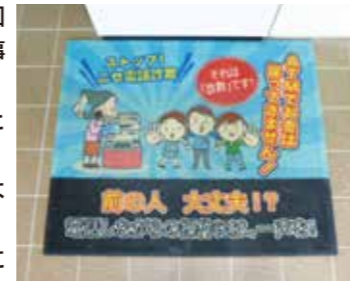
▲店内ATMに設置している「啓発マット」