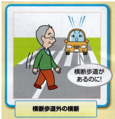
横断歩道外の横断