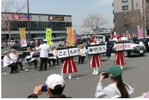
【場所:ゆめマート城野店駐車場】

4月3日、ゆめマート城野店駐車場において、小倉南区交通安全運動出発式を開催しました。出発式には小倉南区長をはじめ、関係