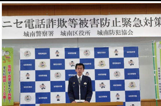
城南警察署長挨拶

ニセ電話詐欺等の被害が急増していることから、令和6年5月9日、城南区役所、城南防犯協会、金融機関、コンビニエンスストア、自治協議会等の関係者約200名にお集まりいただき、緊急対策会議を開催しました。