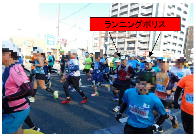
ランニングポリスによる警戒