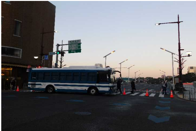
スタート地点における車両突入防止対策 (太陽の橋東交差点)