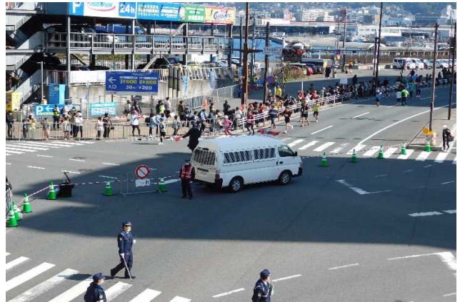
フィニッシュ地点における車両突入防止対策 (国際会議場入口交差点)