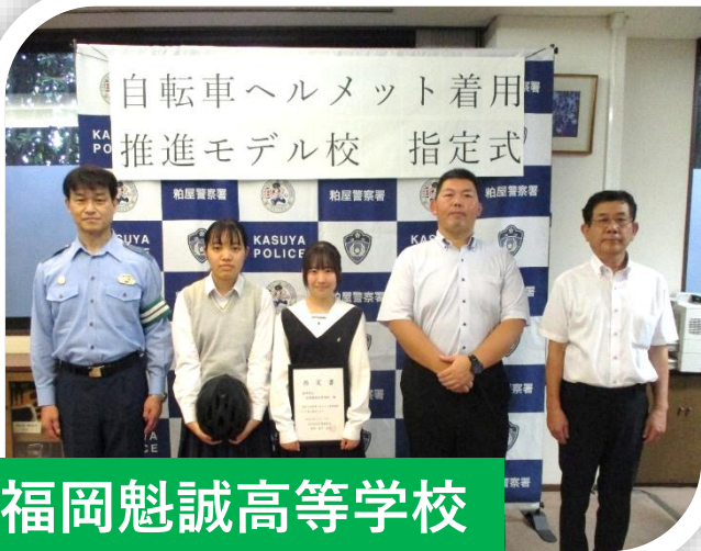
福岡魁誠高等学校