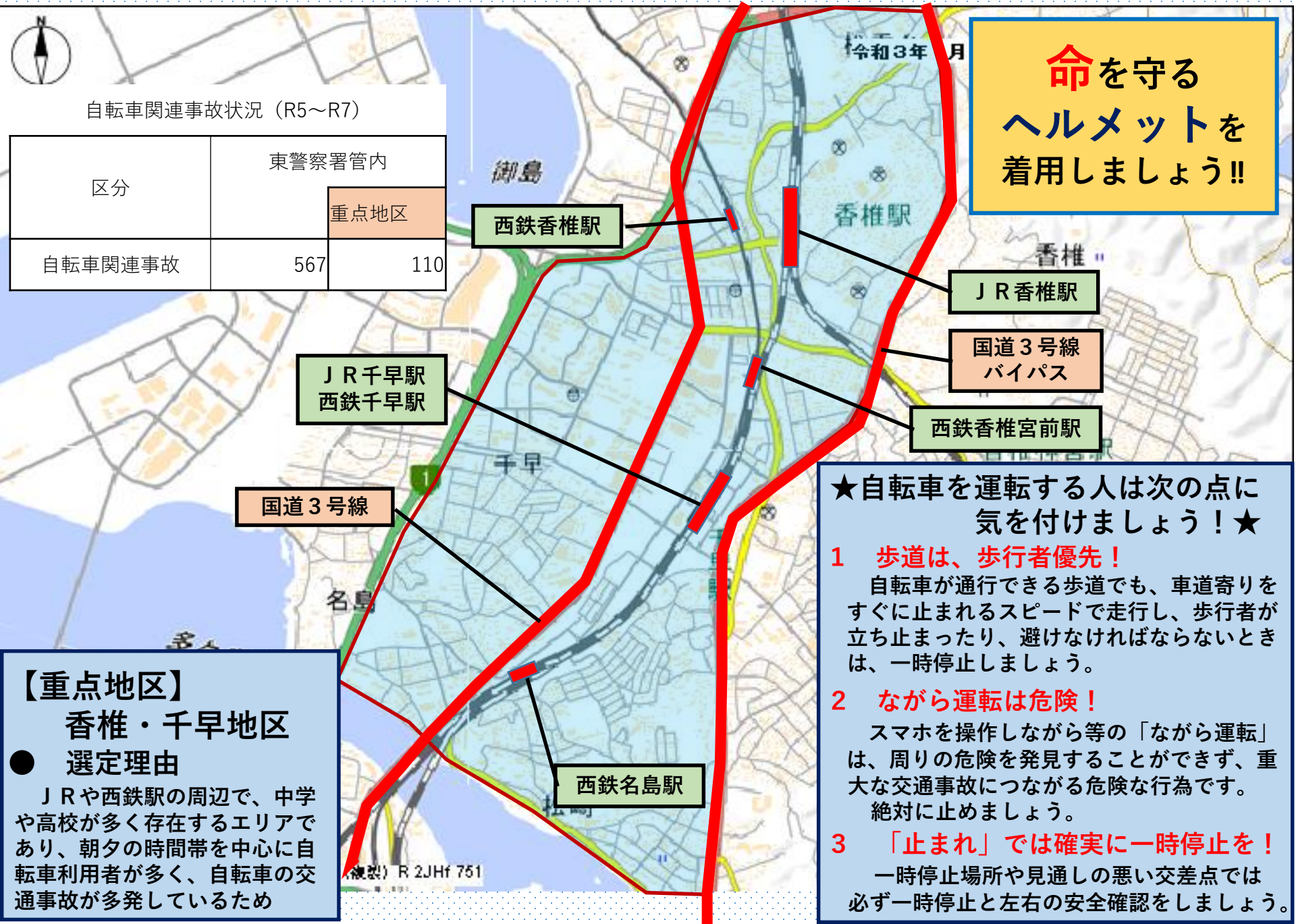
自転車関連事故状況（R5～R7）