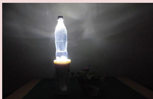
ペットボトル使用時