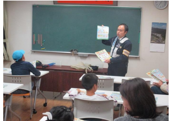
パトロール前に実施している警察官講話