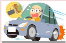
アクセルとブレーキを踏み間違えて大事故！

年齢を重ねると身体機能は衰えます。自身の身体機能の変化を自覚し、自らの安全を守るための交通行動を心掛けましょう。