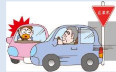
標識を見落として 出会い頭事故に！