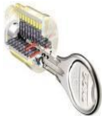
【ピッキング対策錠】