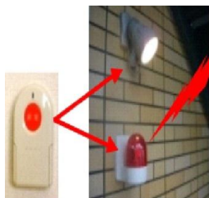
屋外への警報装置

万が一室内に侵入された場合、部屋の中に設置している緊急ボタンを押すことで、屋外に設置している防犯ベルやライトを通して危険を知らせることができる設備を備え付けています。