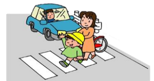
年齢別歩行中死傷者数 (H29~R3) 小学生法令違反別死者・重傷者数