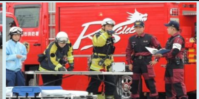
警察と消防の連携