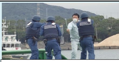
海保によるテロリストの制圧