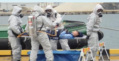
警察NBC部隊による救助・除染