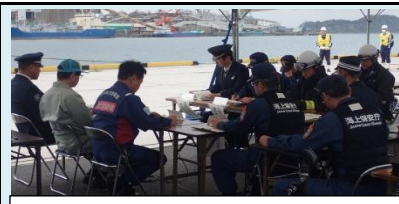
関係機関による協議