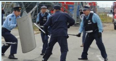
警察によるテロリストの制圧