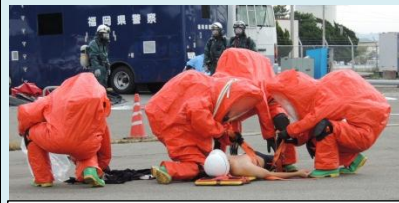
消防NBC部隊による負傷者救助