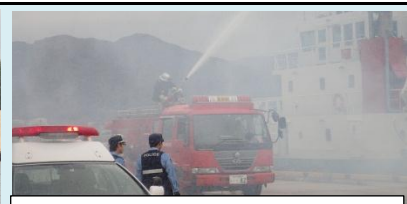
船内火災への消火活動