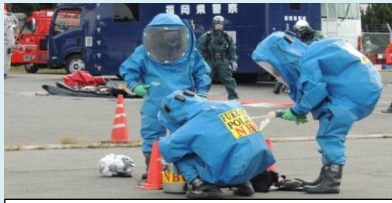
警察NBC部隊による不審物検知