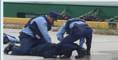
警察によるテロリストの制圧