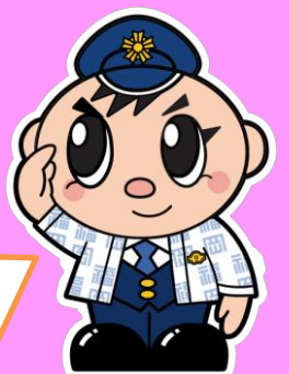
福岡県警察シンボル・マスコット 「ふっけい君」